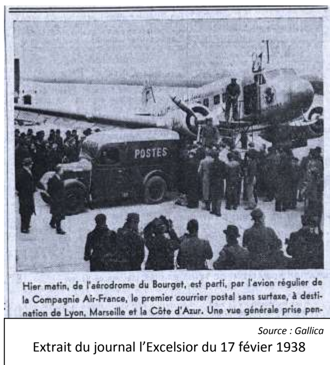
Hier matin, de l'aérodrome du Bourget, est parti, par l'avion régulier de la Compagnie Air-France, le premier courrier postal sans surtaxe, à destination de Lyon, Marseille et la Côte d'Azur. Une vue générale prise pen-

Cette ligne fera escale à Lyon, Orange Plan-de-Dieu, puis Marseille. Il est dit officiellement que Daladier 4 veut mettre le Vaucluse à l'avant-garde du progrès. Peut être faut il y voir aussi une facilité pour visiter son fief de député !